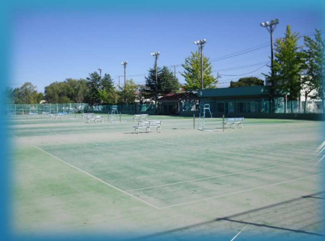
白竜テニスコート