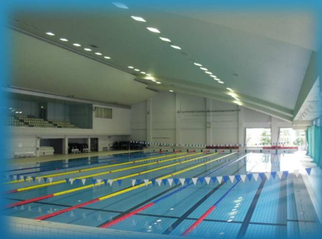
アクアパーク50Mプール

柏崎アクアパーク事業所7施設 (柏崎アクアパーク・柏崎市スポーツハウス・柏崎市武道館・陸上競技場・白竜テニスコート・駅前テニスコート・少年広場運動場) の管理運営